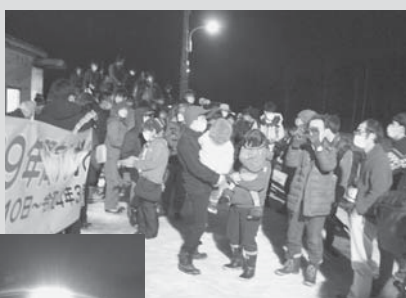
ホームを埋め尽くす たくさんの人々

歌内駅は、大正12年(1923年)11月10日に宇内駅として開業され、昭和26年に地名と同じ歌内駅に改称されました。今日まで住民の客車利用、貨物利用の拠点など、住民生活に密着した駅として活用されてきましたが、地域における離農・転出、郵便局等公共施設の廃止、学校統合などによって利用が年々減少してきており、この度のダイヤ改正に伴い、廃駅となりました。