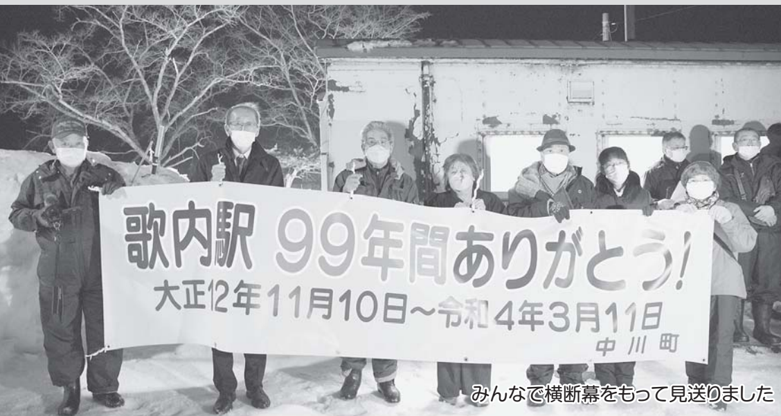
みんなで横断幕をもって見送りました

最終列車がホームに入ると、お別れ会の参加者は、『歌内駅99年ありがとう!』と書かれた横断幕を持って最終列車を見送りました。 大きな拍手と「さようなら」の声の響くなか、列車はゆっくりと歌内駅のホームを離れていきました。