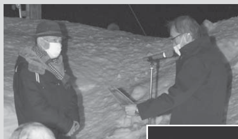
長年にわたって 駅の管理を 行ってきた 樫本ご夫妻