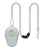
小電力型ワイヤレスリモートスイッチ5（送信機）