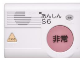
簡易型緊急通報装置「シルバーホン あんしん SV1」

急病や事故等の緊急時にボタンを押すだけで消防署に通報できるシステムのことです。画像のような装置をご自宅に設置します。